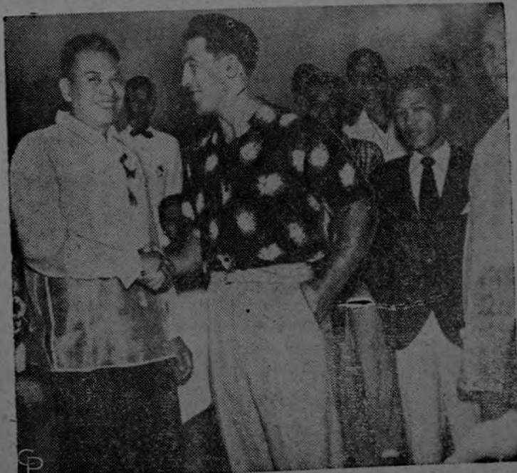
En jira por el Lejano Oriente, el campeón de peso completo Rocky Marciano es saludado por el Presidente Electo Ramón Magsaysay, al detenerse en Manila, Islas Filipinas, donde hizo una pelea de exhibición.

MARCIANO CON EL PRESIDENTE DE LAS FILIPINAS.