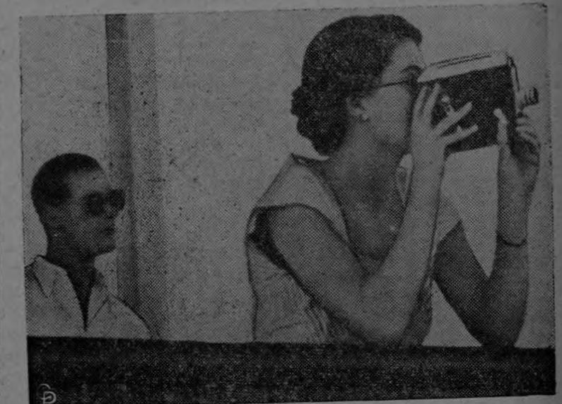
La Reina Isabel II de la Gran Bretaña usa una cámara cinematográfica para fotografiar al crucero neozelandés "Black Prince" que pasó a escoltar al yacht "Gothic" en lugar del crucero británico "Sheffield". En esos momentos el "Gothic" iba camino de las islas Fiji, en el Pacífico, la próxima etapa en la jira de 50.000 millas que hace la Reina por la Mancomunidad. Con ella se ve al Duque de Edimburgo, su esposo. INF.